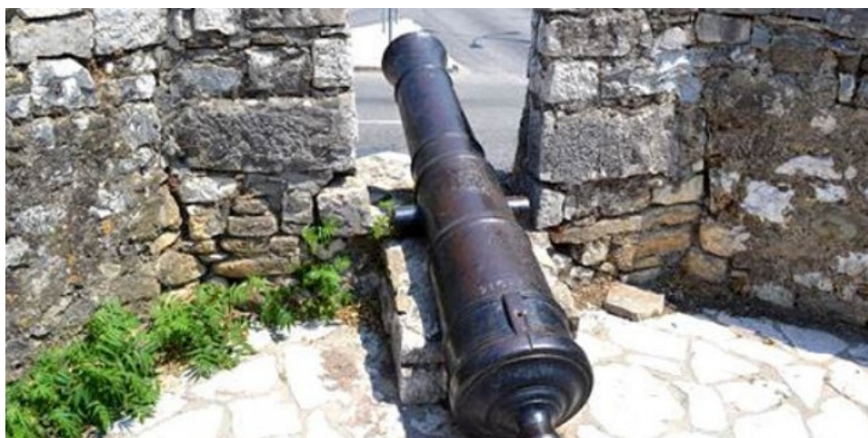
Ντάπια μὲ κανόνια στό τεῖχος τοῦ Μεσολογγίου