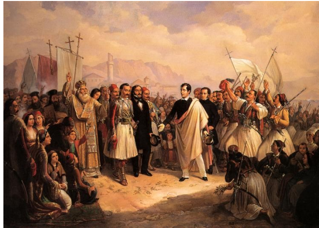
Ἡ ἀφίξη τοῦ Βύρωνα στὸ Μεσολόγγι.