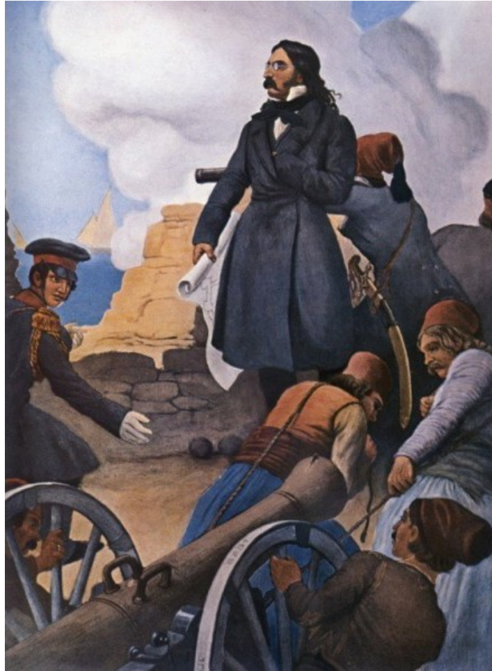
Ὁ Μαυροκορδάτος στὸ Μεσολόγγι μαζί με τοὺς ἀγωνιστές.

Τὸ βιβλίο διαμορφώθηκε σέ ψηφιακή μορφή ἀπὸ ἀντίτυπο γιὰ τίς ἀνάγκες τῆς ιστοσελίδας www.pentalofo.gr