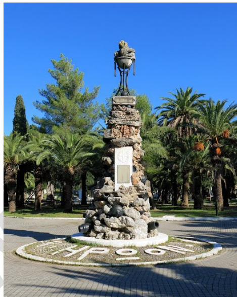
Τὸ μνημεῖο τῶν Φιλελλήνων.