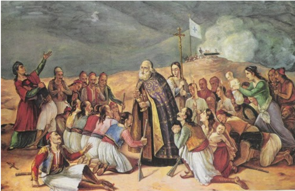
Ὁ ἐπίσκοπος Ἰωσήφ Ρωγῶν μεταλαμβάνει τοὺς ἀγωνιστὲς καὶ τοὺς ὄπλαρχηγούς τῆ νύχτα τῆς Ἑξόδου.