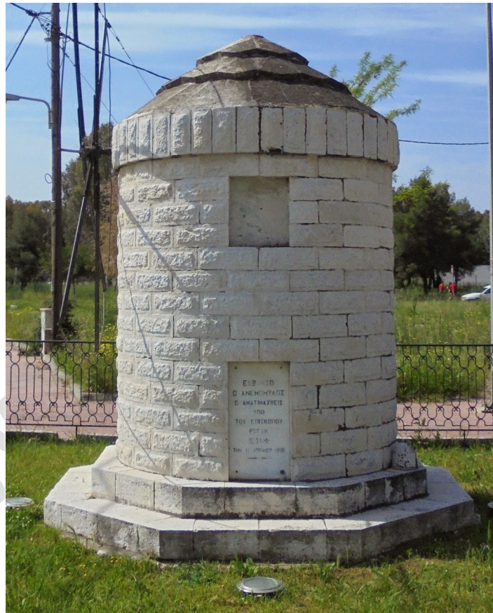
Ὁ ἀνεμόμυλος πού ἀνετίναξε ὁ Ἰωσήφ Ρωγῶν