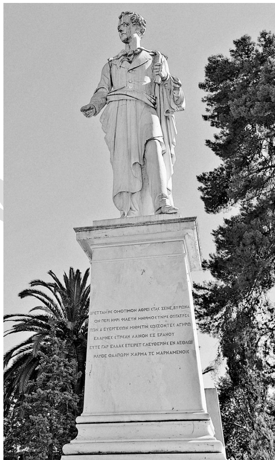
Τὸ ἄγαλμα τοῦ Βύρωνος στὸν Κήπο τῶν ἡρώων.