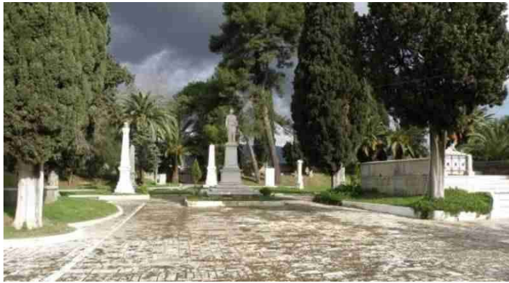
Ὁ κήπος τῶν ἡρώων.