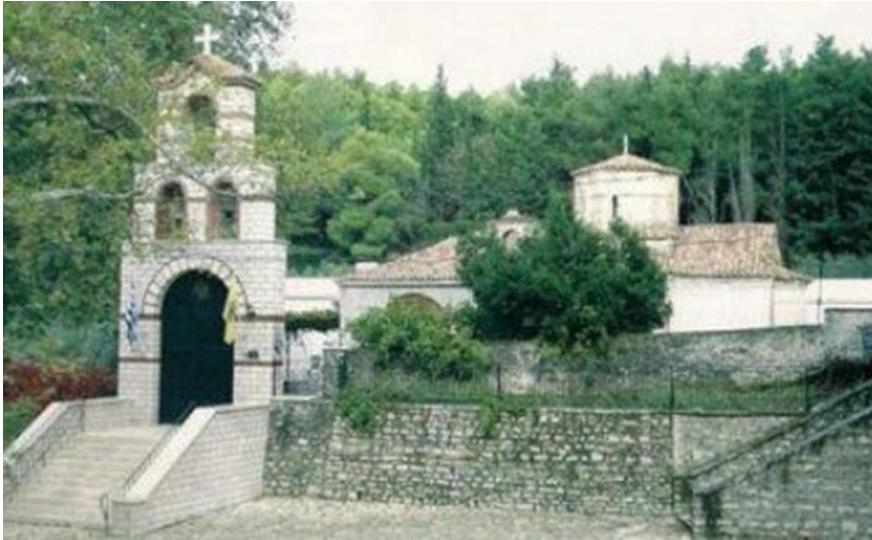
Τὸ μοναστήρι τοῦ Ἁγίου Συμειοῦ μέσα στό καταπράσινο περιβάλλον.