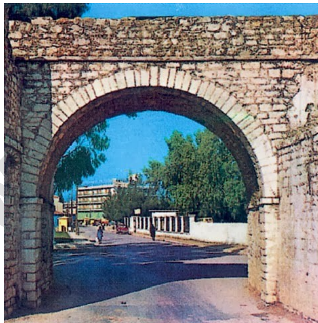
Ἡ Πύλη τοῦ Μεσολογγίου, στὴν εἴσοδο τῆς Πόλεως.