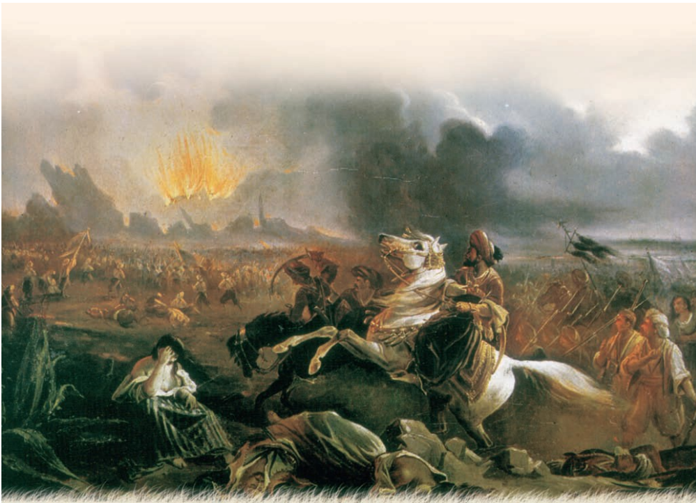
Ἡ ἔφοδος τῶν Τουρκαλβανῶν στὰ τείχη τοῦ Μεσολογγίου.