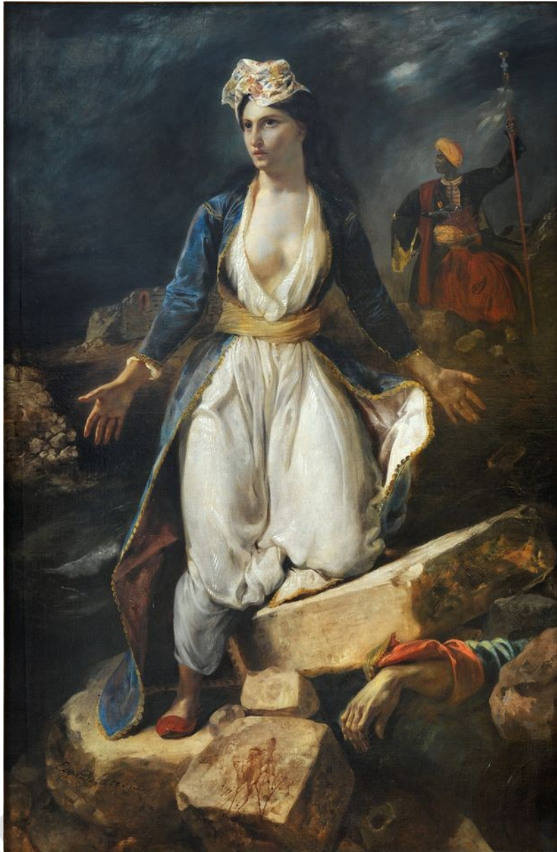
Ἡ ἐλευθερία τὴν ὥρα πού ἀναδύεται ἀπὸ τὰ ἐρείπια τοῦ Μεσολογγίου. Ἔργο τοῦ Ντελακρούα, πού βρίσκεται στὸ Ἐθνικὸ Ἱστορικὸ Μουσεῖο τῆς Ἀθηνᾶς.