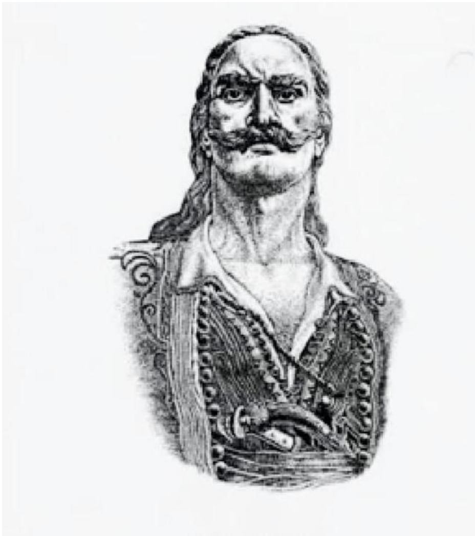
Ο στρατηγός Γρηγόριος Λιακατάς.

Ο στρατηγός Γρηγ. Λιακατάς ήτανε γαμπρός του στρατηγού Στουρνάρη και κατάγονταν από τα χωριά του Ασπροπόταμου. Το 1825 διορίστηκε Γεν. Αρχηγός του Αιτωλικού, από το συμβούλιο των αρχηγών που είχε έδρα το Μεσολόγγι. Όταν κατάλαβε ότι κανένας από τους άλλους αρχηγούς δεν ήθελαν να πάνε να υπερασπιστούν το Ντολμά, πήγε ο ίδιος ακολουθούμενος εθελοντικά από Αιτωλικιώτες και λίγους συγγενείς του.