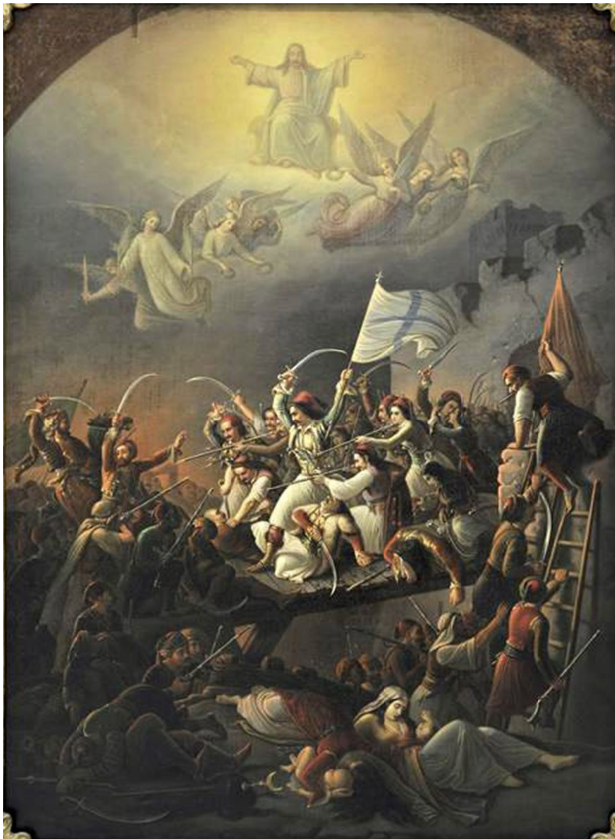
Ἡ ἔξοδος τοῦ Μεσολογγίου