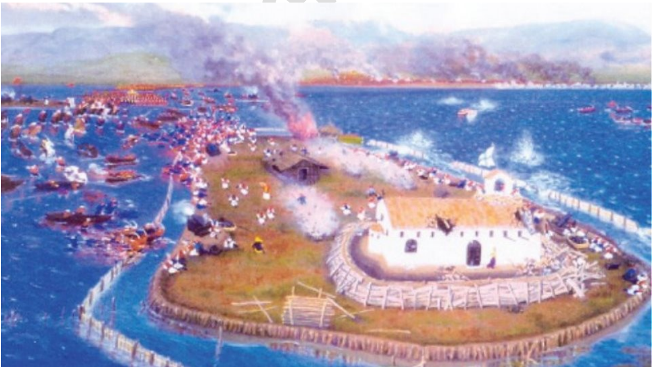
Ἡ μάχη τῆς Κλείσοβας