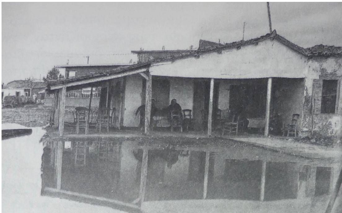
Το «Βελούχι» του Κ. Καλιαντέρη.