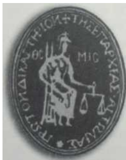
Σφραγίδα του «Πρώτου Δικαστηρίου Αιτωλίας»

Να σημειώσουμε ακόμη, αξιοσημείωτα γεγονότα που συνέβησαν και πρόσωπα που έπαιξαν σημαντικό ρόλο στη διοίκηση της πόλης και στην μετέπειτα ιστορική εξέλιξη του τόπου αυτού, κατά την δεκαετία 1821 έως 1831, όπως η άφιξη του Λόρδου Βύρωνα (5 Ιανουαρίου 1824) και του Ι. Μάγερ (Φεβρουάριος 1822), ο οποίος από 1 Ιανουαρίου 1824 έως 20