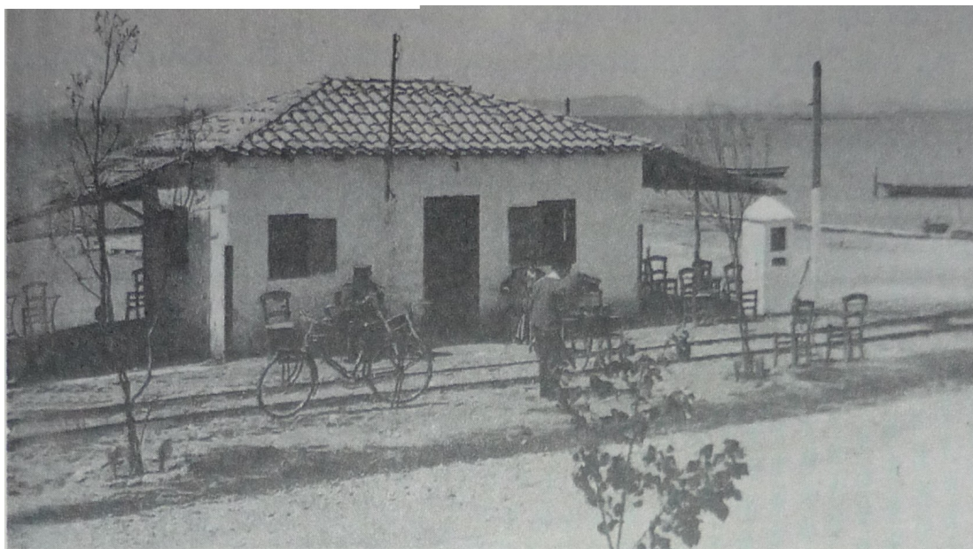
Τα "Καλά Καθούμενα" και το εικονοστάσι του Αγίου Ιωάννου

Ο εμπορικός του στόλος, ήταν ο πρώτος στην Ελλάδα μέχρι τα Ορλωφικά. Το 1735 αριθμούσε 150 νηολογημένα μεγάλα σκάφη στο λιμάνι του, γνωστό ως τα σήμερα με την ονομασία «Καραβοστάσι», που βρίσκεται ανατολικά του Βασιλαδιού (Αη-Σώστης) περί τα 500 μέτρα, όπου τα πλοία παρέμεναν αγκυροβολημένα αρόδο και αποτελούσε σημαντική πηγή πλούτου για ολόκληρο τον πληθυσμό. 10 Διαφωτιστικές σχετικά με τη ναυτιλία του Μεσολογγίου υπήρξαν οι εκθέσεις των προξένων της ενετικής δημοκρατίας (1764). Αναφέρεται ότι από τα 48 Μεσολογγίτικα σκαριά, τα 36 είχαν ναυπηγηθεί στο Μεσολόγγι και από τα 23 Αιτωλικιώτικα, τα 14.