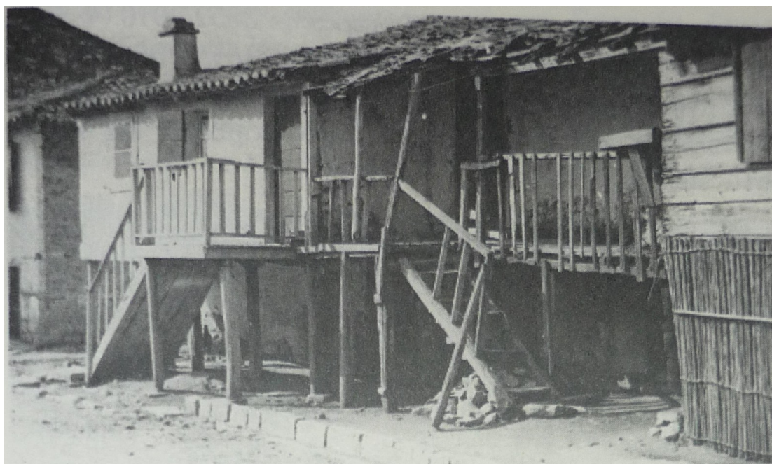
Μετεπαναστατικό οίκημα, επί της οδού Φαβιέρου, που κτίστηκε πάνω στην ανατιναχθείσα οικία του Χρ. Καψάλη. Κατεδαφίστηκε το 1933.

συνενώνονται με τον Δήμο Μεσολογγίου 24 .