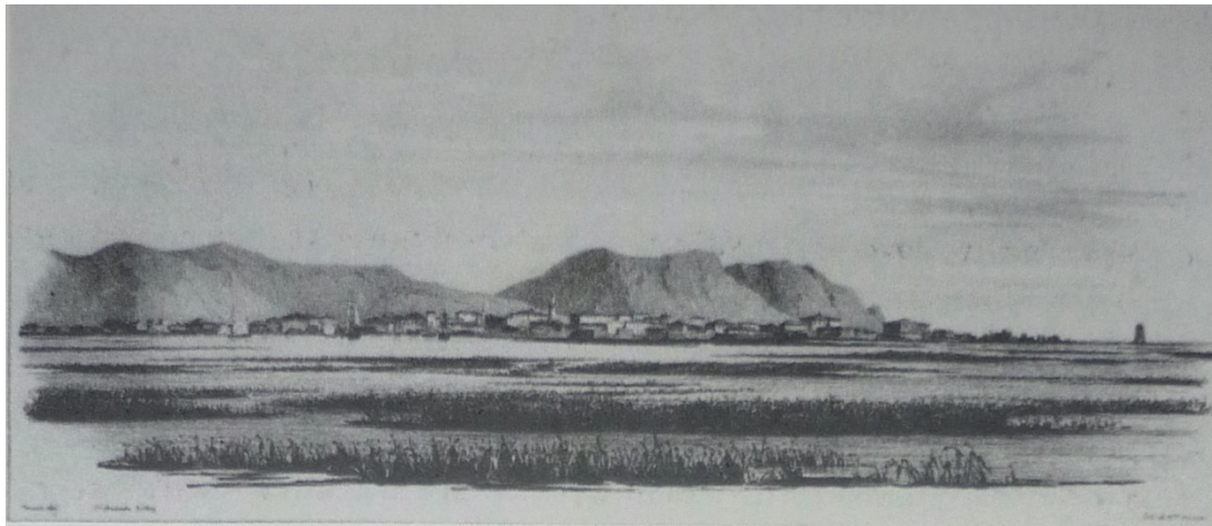
Το Μεσολόγγι προ του 1781 απ' το ζωγράφο Louis Fauvel.

Οι περισσότεροι Μεσολογγίτες χρησιμοποιούσαν για κατοικία τους πελάδες, που ήταν καλύβες πλεγμένες με ειδικό αδιάβροχο χορτάρι που λεγόταν ρένα και καλάμια και στηρίζονταν πάνω σε πασσάλους. Υπήρχαν όμως στην πόλη και πολλά αρχοντικά, μεγάλα και ευπρόσωπα κτίρια, όπως το « Σαράι » (τούρκικο διοικητήριο στα χρόνια της σκλαβιάς που το ονόμαζαν « βοϊβοντικό ») 6 , ιδιοκτησία των Μποτσαραίων μετά την επανάσταση, το οποίο κάηκε το 1949 και βρισκόταν βορείως απ' το σημερινό Δημαρχείο - Πινακοθήκη, τα Καφαλαίικα σπίτια (σ' ένα απ' αυτά έμεινε και πέθανε ο Λόρδος Βύρων) και τ' αρχοντικά των Παλαμάδων, Τρικούπηδων, Βάλβηδων, Ραζηκότσικα, Δεληγιώργη, Παπούλα, Σιδέρη, Σμαιλογιάννη. 7 Οι φτωχοί ξωμάχοι, κατοικούσαν στο ΒΑ άκρο της πόλης, που γειτόνευε με τον κάμπο, έμεναν σε λασπόχτιστες καλύβες και γι' αυτό τους αποκαλούσαν « καλυβιώτες ». Την ονομασία Καλύβια την κράτησε η συνοικία αυτή μέχρι και σήμερα.