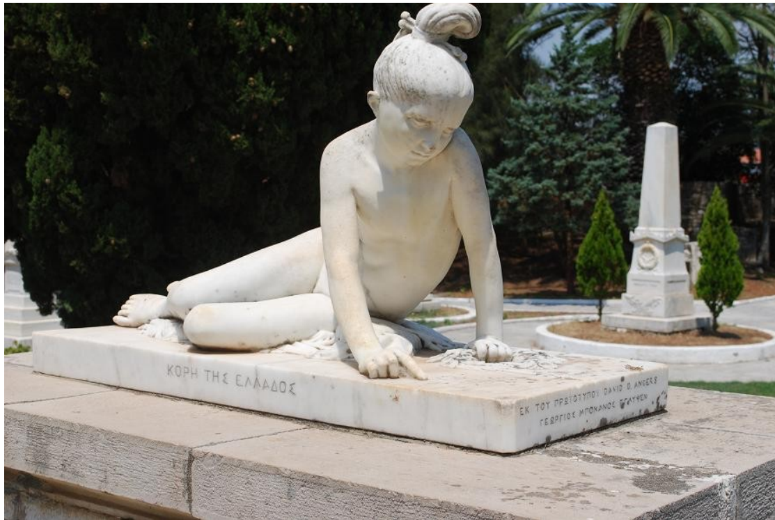
Η «Κόρη της Ελλάδος» (αντίγραφο) στον Κήπο των Ηρώων.

Ο επισκέπτης και προσκυνητής θα σταθεί μπροστά στις στήλες αγωνιστών, όπως των: Ρωγών Ιωσήφ, Θ. Γρίβα, Ν. Κασομούλη κ.ά. και των φιλελλήνων Αμερικανών, Γάλλων, Γερμανών, Ιταλών, Πολωνών, Ρώσων και Κυπρίων αγωνιστών. Και πριν περιηγηθεί τον Κήπο θα χει την ευκαιρία μπαίνοντας μέσα να διαβάσει σε ειδική στήλη το ψήφισμα του Καποδίστρια για τη δημιουργία του Κήπου των Ηρώων.