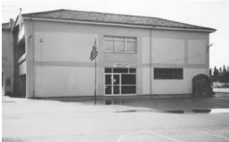
Το Δημοτικό Σχολείο Πενταλόφου

έχουν αναλάβει τη φρονίδα τους, αλλά ακόμα και όταν σκέφτονται ότι θα τους συμβεί κάτι τέτοιο. Σε αυτήν την περίπτωση το έντονο υπερπροστατευτικό περιβάλλον δυστυχώς εντείνει και δυσκολεύει την κατάσταση. Ένα ποσοστό 2% περίπου του μαθητικού