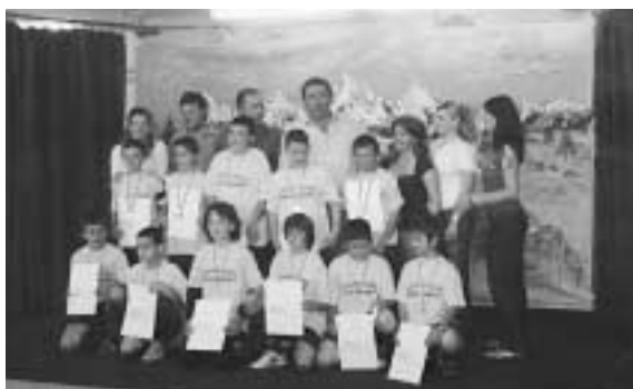
Δάσκαλοι και μαθητές - ποδοσφαιριστές. Όλοι τους άξιοι πρωταθλητές.