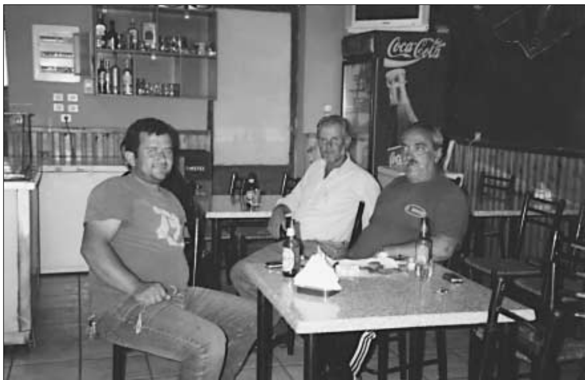
Περισυλλογή και σκέψη...

- Σήμερα έχουμε Θρησκευτικά για τ' μιλιτζάνα!!!