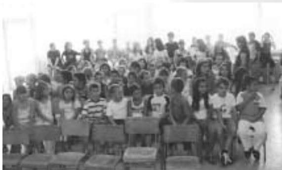
Μαθητές του Δημοτικού Σχολείου.