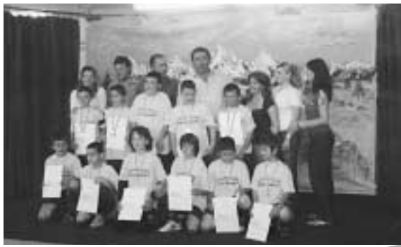
Δάσκαλοι και μαθητές - ποδοσφαιριστές. Όλοι τους άξιοι πρωταθλητές.