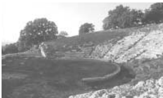
Το Αρχαίο Θέατρο Οινιαδών

«Εκκλησιάζουσε» του Αριστοφάνη από την Αττική σκηνή. Πρωταγωνιστούν οι Γ. Παρτσαλάκης, Τάσος Χαλκιάς, Τάσος Παλατζίδης. Σκηνοθεσία: Θανάσης Θεολόγης, σκηνικά και κοστούμια: Μ. Μαχαιριανάκη, μουσική: Γιούρι Στούπελ, χορογραφίες: Πέτρος Γάλιας.