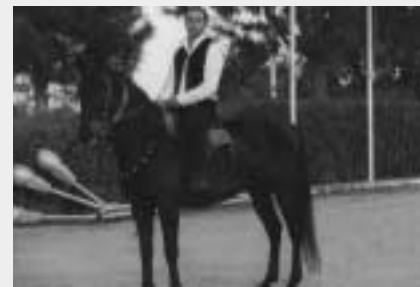
Στιγμιότυπα από την εκδήλωση

Κι ύστερα «από χαράματα μεριά» όλοι μαζί παντινάδα με τα νταούλια στους δρόμους. Ραστ, Καρακάξα , ατελείωτο κέφι στους νέους και βαθειά συγκίνηση στους παλιούς.