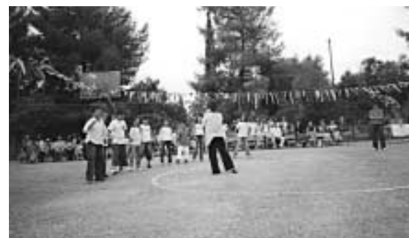
Χοροί από τη γιορτή 2005