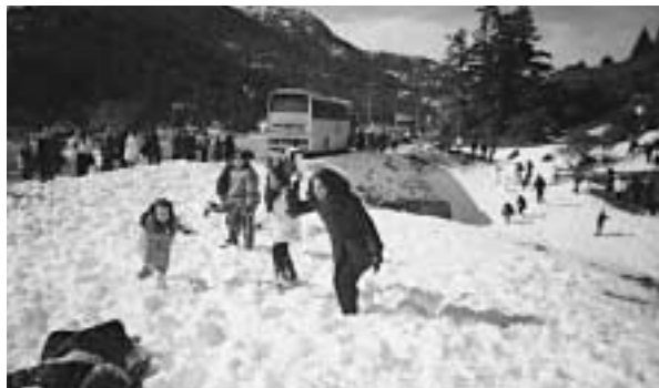
Εκδρομή στα Καλάβρυτα

Τον Νοέμβριο του 2004 μετά από πολλές προσπάθειες και αφού πριν μας πέρασε από το μυαλό να τα παρατήσουμε, αφού δεν υπήρχε συμμετοχή - οργανώσαμε το σύλλογό μας με πίσμα και θέληση να αλλάξουν κάποια θέματα γύρω από το σχολικό περιβάλλον.