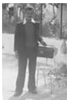
Που πάτε κύριε;!!!

Κεντρικό: Σπύρου Μουστακχή 16, Μεσολόγγι Υποκατάστημα: Νεοχώρι Οινιάδων Τηλ.: 6974 839474 - 6976 190222 Εξυπηρετούμε όλη την Ελλάδα και το εξωτερικό