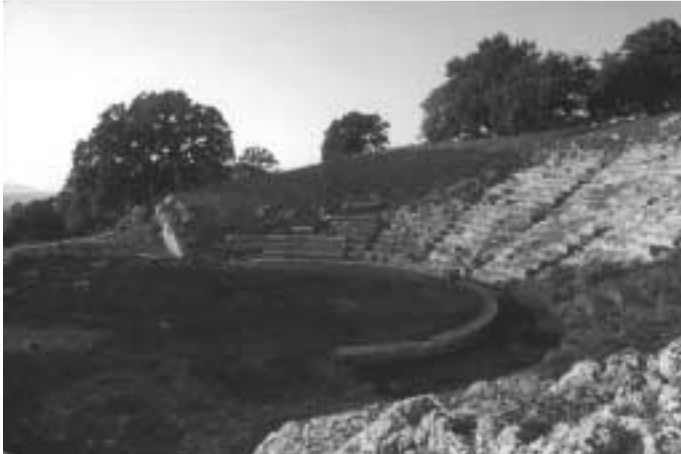
Το Αρχαίο Θέατρο Οινιάδων