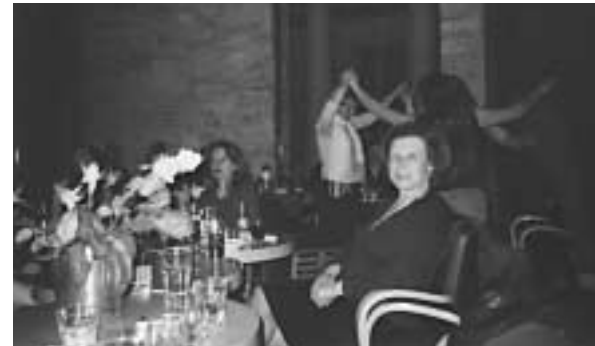
Χορός γυναικών 2006