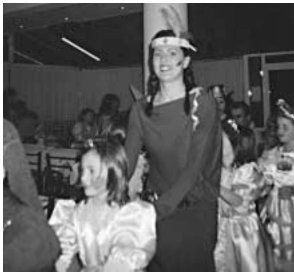
Αποκριάτικος χορός 2006, με τη συμμετοχή και των δασκάλων

Τέλος κρίναμε απαραίτητο να επιχορηγήσουμε με κάποιο ποσό από το ταμείο μας συγχωριανούς μας που βρίσκονταν σε δύσκολη κατάσταση.