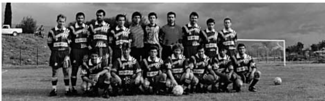
Παλαιότερη φωτογραφία του Α.Ο. Πενταλόφου

Έμφυχο υλικό υπάρχει και μάλιστα αξιόλογο. Οι ποδοσφαιριστές που θα σηκώσουν το βάρος στον αγωνιστικό τομέα είναι οι παρακάτω (σειρά αλφαβητική):