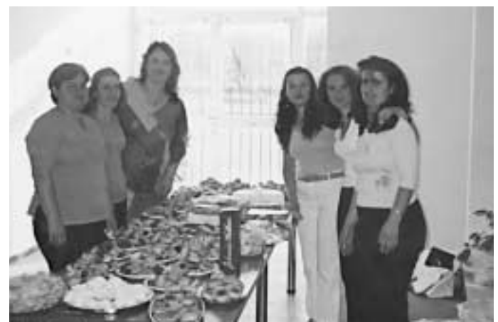
Τα μέλη του δραστήριου Διοικητικού Συμβουλίου

Άξιο επαίνων και συγχαρητηρίων είναι το Διοικητικό Συμβούλιο του Συλλόγου Γονέων και κηδεμόνων του Δημοτικού Σχολείου του χωριού μας.